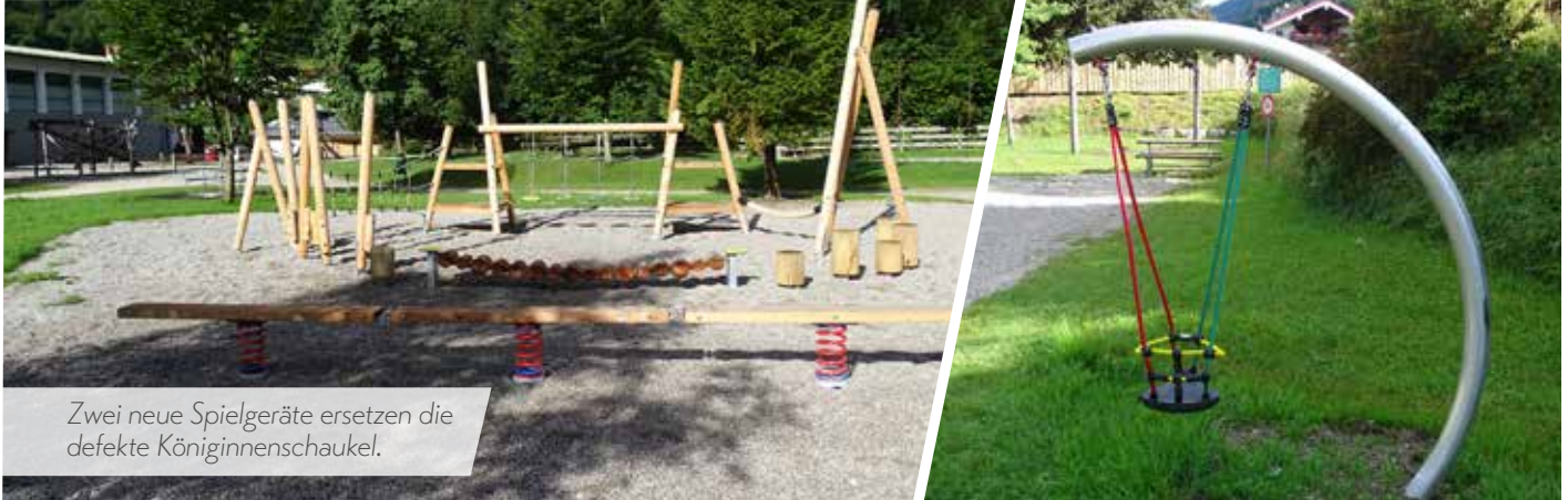
Zwei neue Spielgeräte ersetzen die defekte Königinnenschaukel.

Wir wünschen unseren kleinen Bürgern viel Spaß mit den neuen Spielgeräten!