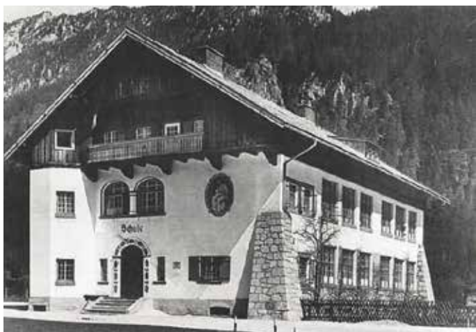
Die Zentralschule Bischofswiesen im Jahr 1924.