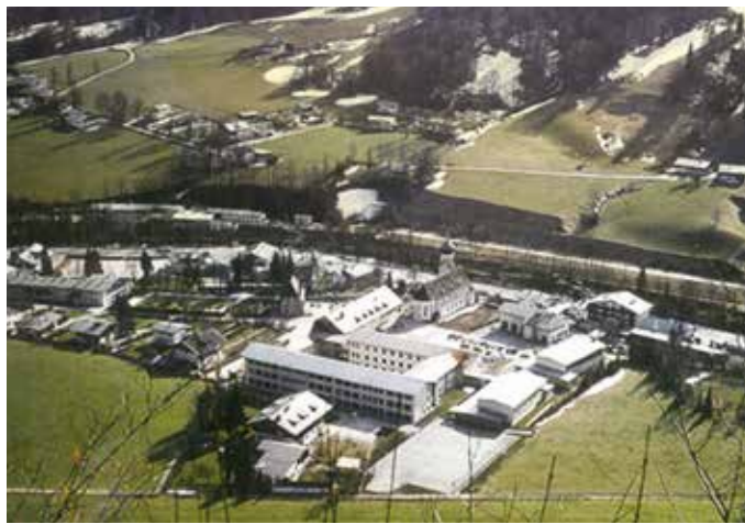
Schulareal in 70er-Jahren, damals noch mit Sportplatz.