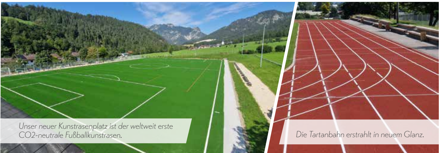
Unser neuer Kunstrasenplatz ist der weltweit erste CO 2 -neutrale Fußballkunstrasen.

Mit diesen Maßnahmen ist die Schul- und Breitensportanlage am Riedherrn nun bestens für die kommenden Jahre gerüstet.