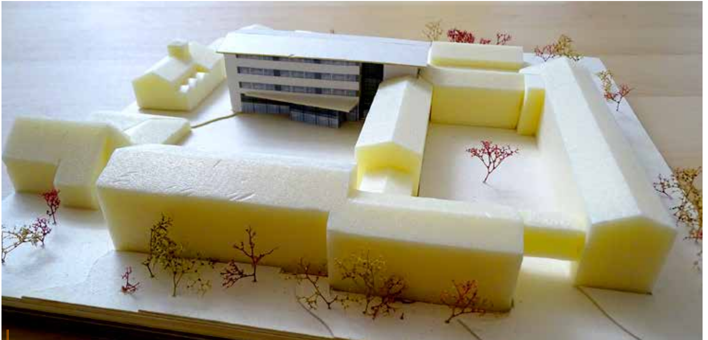
Im Anbau der Grund- und Mittelschule Bischofswiesen entstehen die benötigten Klassen- und Mehrzweckräume, sowie die Aula und eine Mensa.