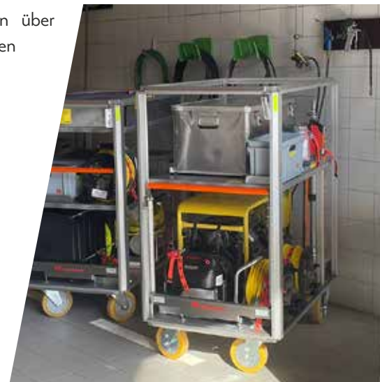
Mit den Rollcontainern können Hochwasserpumpen schnell und einfach im Notfall transportiert werden.