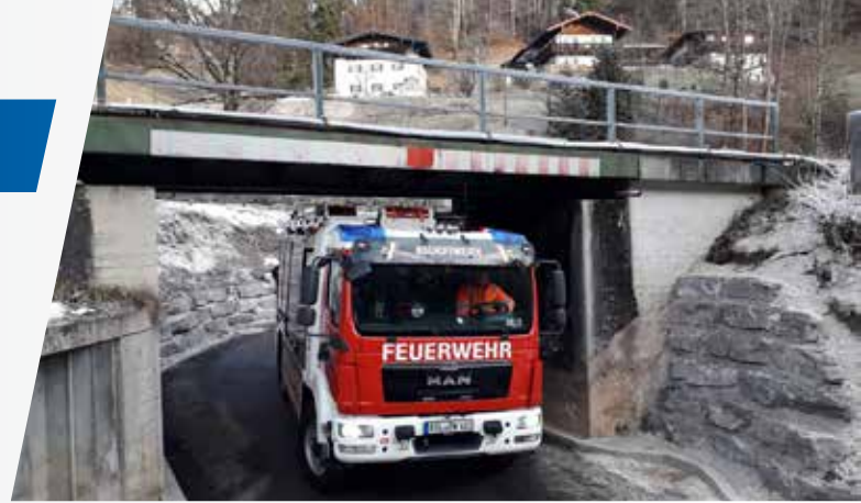
Durch die Durchfahrterhöhung können nun alle gängigen Rettungsfahrzeuge die Unterführung problemlos passieren.

Der neu geplante Bahnhaltepunkt in Winkl soll nach Aussage der Deutschen Bahn im Herbst 2025 „ans Netz“ gehen. Die Planungen bei der Bahn laufen. Man „hört“ zwar wenig, aber gelegentlich sieht man Personen mit Warnwesten und Messgeräten am geplanten neuen Standort. Die Gemeinde hat einen ersten Entwurf für die Zuwegung zum Bahnhaltepunkt beauftragt. Dieser Entwurf wird mit den Betroffenen, wie zum Beispiel dem Staatlichen Bauamt, dem Landratsamt und der RVO abgestimmt, um auch diese Belange zu berücksichtigen. Parallel wird er im Rathaus und im Gemeinderat diskutiert und ein erster Plan erstellt. An diesem Plan sollen dann anschließend die Feinabstimmungen erfolgen.