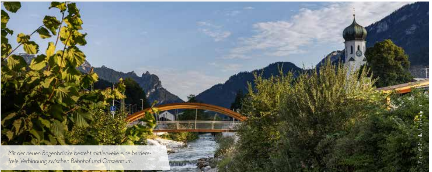
Mit der neuen Bogenbrücke besteht mittlerweile eine barrierefreie Verbindung zwischen Bahnhof und Ortszentrum.

Nach mehr als fünf Jahren Planung und Bau steht nun endlich die Bogenbrücke, welche am 14.03.2022 für die Öffentlichkeit offiziell eröffnet werden konnte. Die neue Brücke mit der markanten Holzbogenkonstruktion, überspannt die Bischofswieser Ache und verbindet den neuen Bahnhof barrierefrei mit dem Ortszentrum. Hier wurde in Verbindung mit der Ampelanlage mehr Sicherheit im Straßenverkehr für unsere Bürgerinnen und Bürger, aber vor allem für alle Schülerinnen und Schüler, geschaffen.