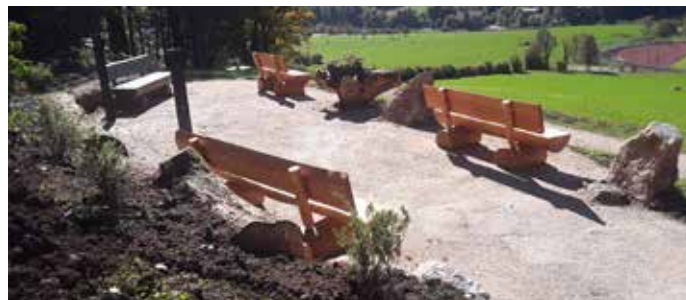
Der liebevoll gestaltete Rastplatz am „Reitweg“ lädt zum Verweilen und Genießen ein.

Dank gilt allen beteiligten Helfern, die einen wunderbaren Ort der Erholung für unsere Bürgerinnen und Bürger geschaffen haben!