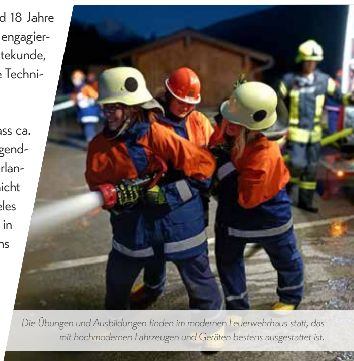
Die Übungen und Ausbildungen finden im modernen Feuerwehrhaus statt, das mit hochmodernen Fahrzeugen und Geräten bestens ausgestattet ist.