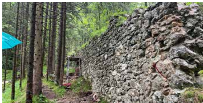
Die Sanierung des ersten Abschnitts der historischen Wehrmauer am Hallthurm konnte heuer abgeschlossen werden.

ung eingesetzt wurde. Die Firma hat Hervorragendes geleistet und so konnte die Sanierung des ersten Abschnittes im Sommer dieses Jahres abgeschlossen werden. Wir hoffen, dass auch weitere Sanierungsmaßnahmen finanziert werden und wir für unsere Nachfahren ein wichtiges historisches Denkmal erhalten können.